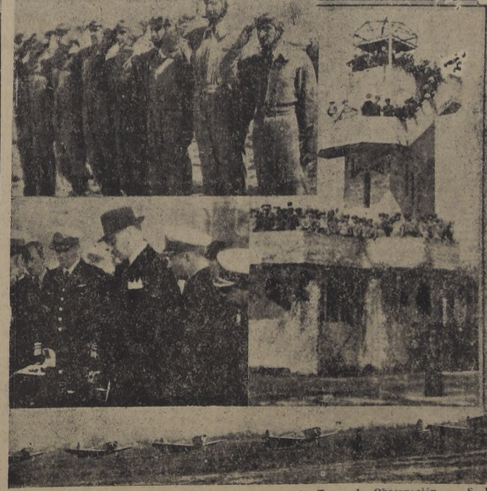
Los pilotos saludan a S. E. — Público apostado en la Torre de Observación. — S. E. y Jefes de la Fuerza Aérea, observan una explicación técnica. — Vista de algunas de las nuevas máquinas

Ejercicios de tiro y pruebas en tierra de paracaídas BOMBARDEOS Se apreció el grado de preparación alcanzado por la Fuerza Aérea UNA COLACION