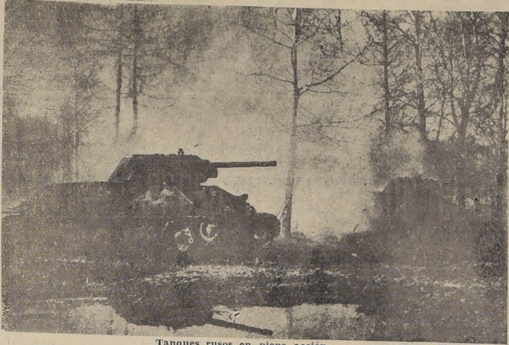
Tanques rusos en plena acción.

BUENOS AIRES, 29 (U. P.) — El pueblo argentino, por intermedio de sus representantes parlamentarios, tuvo hoy la última oportunidad de manifestar su opinión al Presidente Castillo, respecto de la política exterior hasta la apertura de la próxima sesión del Congreso, en mayo de 1943. En efecto, en una doble votación, los diputados insistieron en que se diera cumplimiento a las recomendaciones de la Conferencia de Río de Janeiro mediante la ratificación del pacto, y en seguida exigió que el Gobierno rompiera las relaciones con el Eje. El plazo fatal para la discusión de la política exterior venció a las 10 P. M. La Cámara se pronunció en favor de la aprobación de los acuerdos de Río de Janeiro, que incluyen un proyecto de relaciones diplomáticas con las naciones del Eje, por 70 votos contra 59. La votación de la moción Taborda arrojó 87 votos contra 64. Se recordará que esta no comprende un proyecto de ley, sino meramente una recomendación en que expresa la opinión de la Cámara, la que será comunicada al Presidente Castillo. El proyecto de ratificación de las recomendaciones de Río de Janeiro pasan ahora al Senado, donde se cree que probablemente será encarpetado. El Congreso entrará en receso mañana a medianoche, y no hay posibilidad de que las sesiones sean prorrogadas. Después de esa fecha el estado de sitio no permite la discusión de la política exterior, de modo que la última palabra sobre la materia durante los próximos nueve meses ha sido oída esta noche.