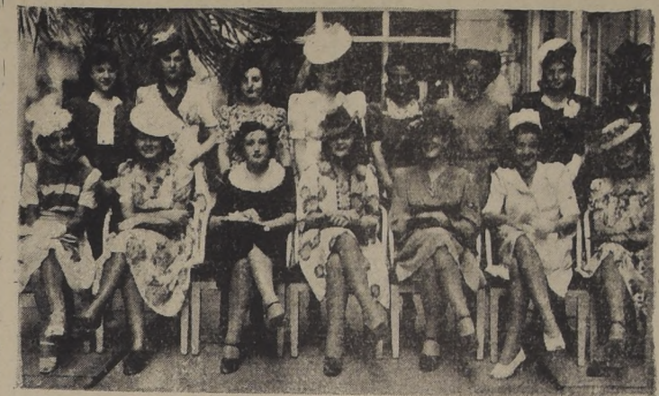
Manifestación de despedida de soltera en los salones del Crillon...