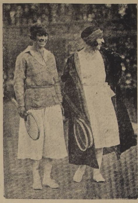
Susana Lengien y Mrs. Lambert Chambers jugaron en 1919 la final del Campeonato de Wimbledon. Era la primera vez que...