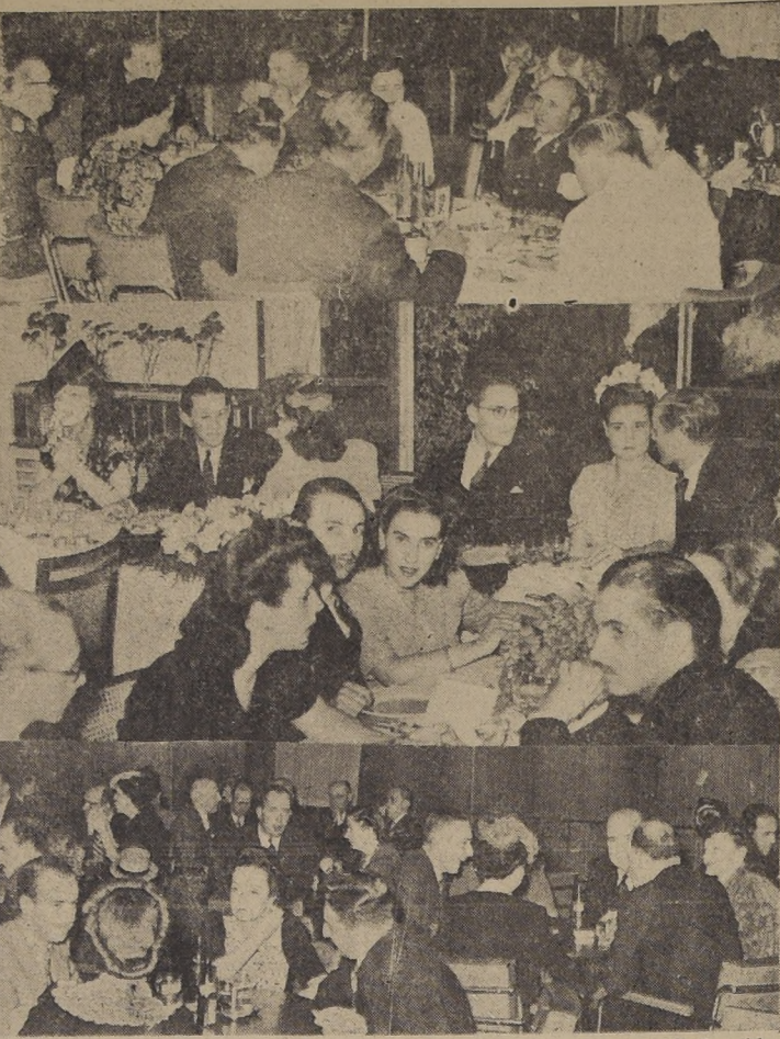
Grill Room, Roof Garden y Bar Central del hotel, concurridos por distinguidas personalidades de nuestro mundo social