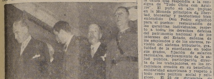
S. E. el Presidente de la República, durante el homenaje rendido en el Teatro Municipal, acompañado de varios Ministros de Estado.

Con motivo de haberse cumplido ayer el primer aniversario del fallecimiento del que fuera Presidente de la República, señor don Pedro Aguirre Cerda, los elementos políticos de izquierda y las organizaciones proletarias, realizaron diversos actos de conmemoración, en que rindieron fervoroso homenaje a sus virtudes ciudadanas. La figura de eminente ciudadano cobró ayer nuevo relieve al revivir en el alma agraciada de la clase media y del pueblo, que recordaron cuánto hizo por su bienestar desde el alto cargo de Jefe del Estado. Los homenajes rendidos a su