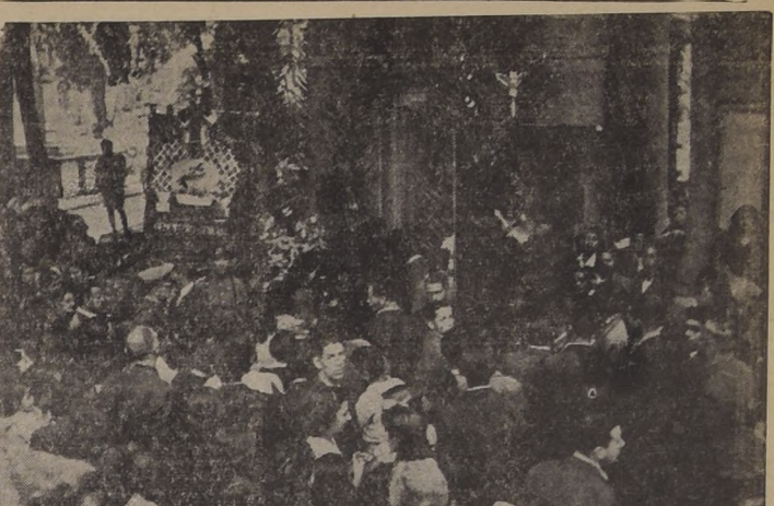
Aspecto general de la romería a la tumba de don Pedro Aguirre Cerda