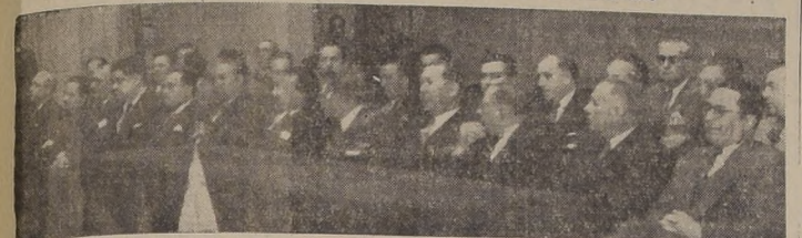
La mesa directiva de la velada fúnebre en el Teatro Municipal

EN EL PRIMER ANIVERSARIO DE LA MUERTE DEL EX MANDATARIO, SENADORES Y DIPUTADOS RECORDARON SUS GRANDES VIRTUDES CIUDADANAS—S. E. EL PRESIDENTE DE LA REPUBLICA ASISTIO A LA VELADA FUNEBRE EN EL T. MUNICIPAL.—EL HOMENAJE DE LOS ORGANISMOS POLITICOS, OBREROS Y CULTURALES