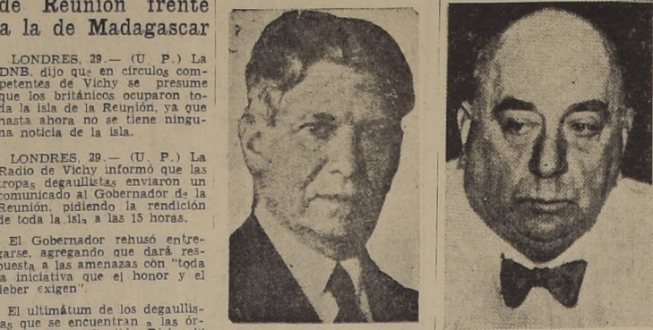
Don Juan José Amezaga, Presidente electo de Uruguay y Don Alberto Guani, nuevo vicepresidente de Uruguay.

MONTEVIDEO, 29.—(U. P.)—La abrumadora victoria de Amezaga y Guani quedó asegurada al conocerse los resultados parciales de las elecciones presidenciales recibidos por el Gobierno hasta las últimas horas de la noche, los que indicaban que la fórmula citada aventajó desde el principio en forma considerable a los demás candidatos a la Presidencia y Vicepresidencia de la nación, justificando así la declaración que algunas horas antes el Presidente Baldomir hizo a la United Press, de que Amezaga era el nuevo Presidente.