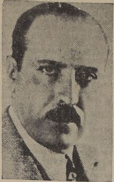
Presidente Arroyo del Río