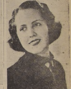
El más noble objetivo de la vida son los hijos. En nombre de este sagrado afecto, colmemos de felicidad a los niños pobres en Pascua de Navidad.