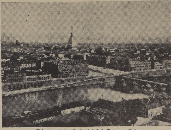
Vista panorámica de la ciudad de Turín, en Italia

Los alemanes siguen reforzando (PASA A LA PAG. 6)