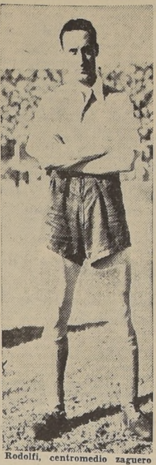
Rodolfi, centrocampista zaguero

NECESITAMOS LOCAL PARA GUARDAR AUTO Si es posible con casa habitación dar antecedentes Al diario "LA NACION"