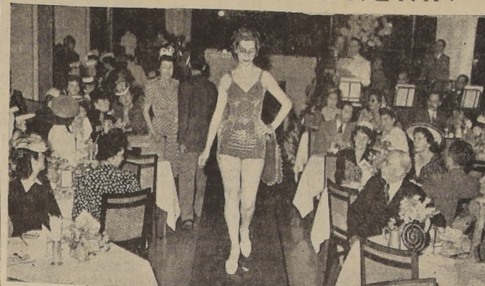
Aspecto de la presentación de Maniquín Vivants efectuado ayer en el Living del Hotel, por la Casa Flaño, que reunió a la más selecta de nuestro mundo social...