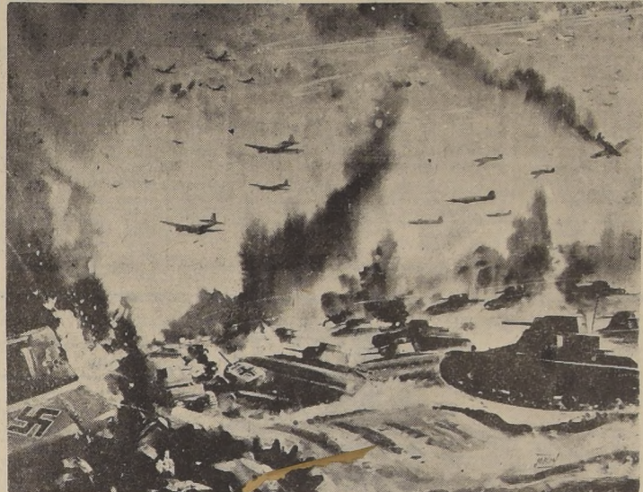
Habiendo sido cortadas en dos las fuerzas de Rommel, una gran parte de ellas quedó cercada por los británicos, los que están empeñados en una lucha por aniquilarlas mediante intenso fuego de artillería, aviación y embestidas de sus fuerzas mecanizadas

El comunicado británico de hoy decía que las tropas enemigas habían sufrido ya bajas de consideración y continuaban recibiendo implacable castigo. El movimiento de flanco que (PASA A LA PAGINA 6)