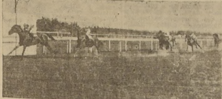
Taltal, delante de Let Go, Corcho y Golden Chimes, en el "Jorge Phillips Huneeus"

DERROTO POR UN LARGO A LET GO, REMATANDO TERCERO CORCHO, A DOS CUERPOS.—GOLDEN BOY RODO EN FORMA ESPECTACULAR.—EN LAS OTRAS CARRERAS GANARON CHIAVARI, AMIGABLE ($ 418.20 CON 5) ZINGARO, PIRATA, CHICO HERMOSO, ENEMIGO Y CRISPIN