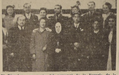
El Director, con parte del personal de la Escuela de la Casa Nacional del Niño

En todo momento se ha contactado con la cooperación de los médicos, visitantes sociales, enfermeros y personal en general para realizar en la mejor forma una buena labor educacional. La Escuela de los Talleres está formada por alumnos cuya