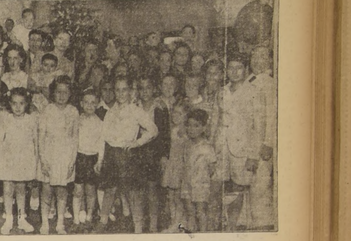
En la subsecretaría de Marina, durante el reparto de juguetes a los hijos del personal de esa repartición...