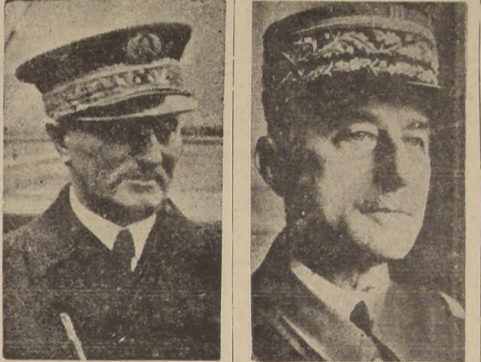
Almirante Darlan General Nogues

Mientras se designa sucesor al extinto almirante J. F. Darlan