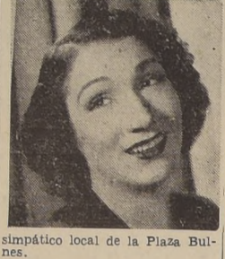
simpático local de la Plaza Bulnes.