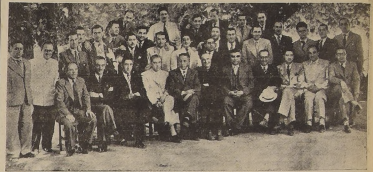
Asistentes a la Asamblea General que celebró ayer el Círculo de Cronistas Deportivos. Estuvieron representados: LA NACION, "El Mercurio", "El Diario Ilustrado", "La Hora", "Defensa", "La Razón", de Buenos Aires, "El Llanquihue", de Puerto Montt, "El Correo", de Valdivia, "El Siglo" y "El Chileno".