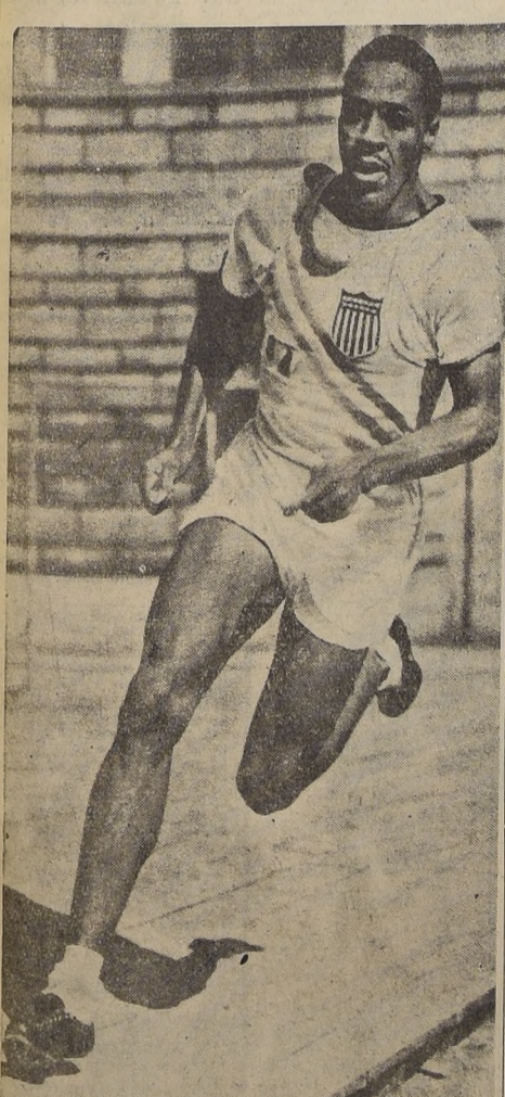
John Borican, el atleta norte americano de color, poseedor del record mundial de las 1.000 yardas y de los 1.000 metros en pista cubierta, muerto recientemente. Media 2 metros de estatura y pesaba alrededor de 100 kilos. Fue alumno de la Universidad de Columbia.