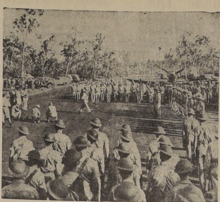
El general George H. Brett, comandante de las fuerzas aéreas de las Naciones Unidas...