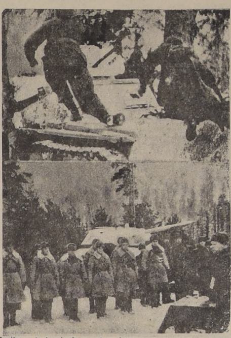
Arriba, a la izquierda, un dramático momento de una de las batallas entre tanques e infantería en el frente central de Rusia. — Abajo, condecorando a los héroes de la batalla de Stalingrado

Oficina de Informaciones y Reservas: Huérfanos 1102 --- Teléfono 68886 (Oficina Informaciones de los Ferrocarriles)