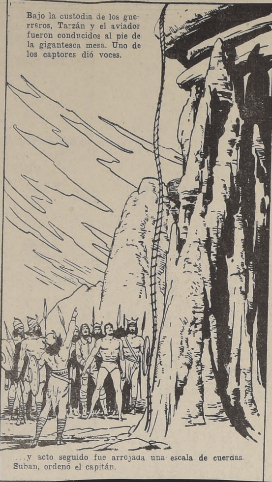
Bajo la custodia de los guerreros, Tarzán y el aviador fueron conducidos al pie de la gigantesca mesa. Uno de los captores dió voces.