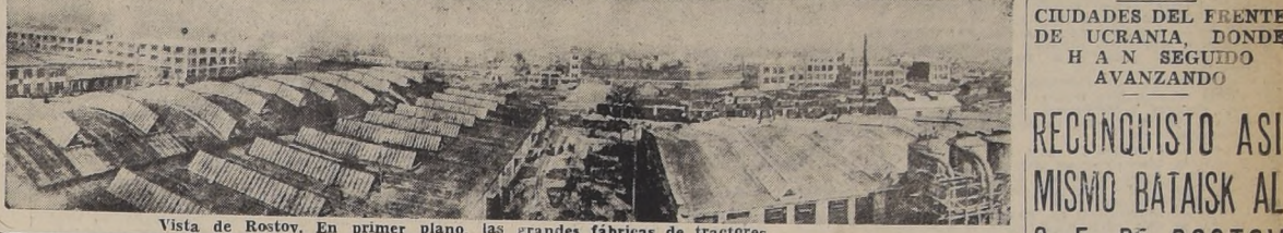
Vista de Rostov. En primer plano, las grandes fábricas de tractores