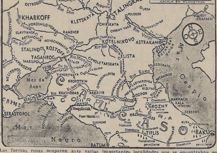
Las fuerzas rusas ocuparon ayer varias importantes localidades que se encontraban en poder de los alemanes...