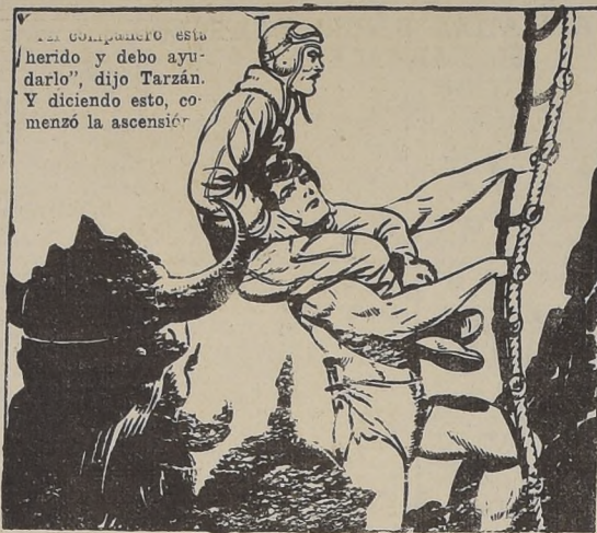
El compañero está herido y debo ayudarlo", dijo Tarzán. Y diciendo esto, comenzó la ascensión.