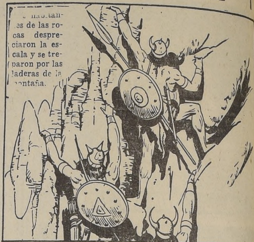
Los talleres de las rocas despreciaron la escala y se treparon por las ladderas de la montaña.