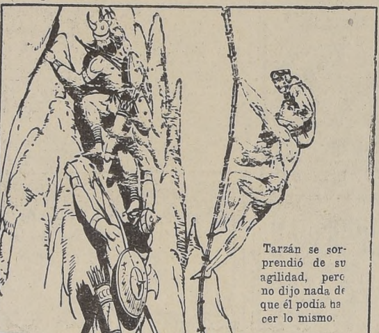
Tarzán se sorprendió de su agilidad, pero no dijo nada de que él podía hacer lo mismo.