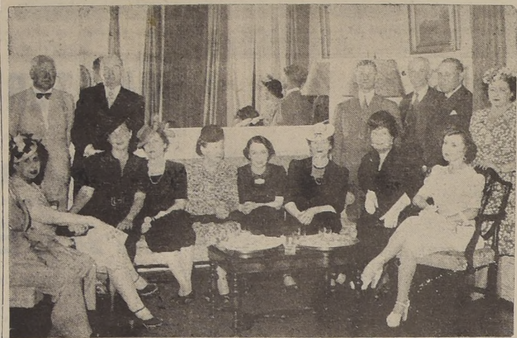
Asistentes a la recepción ofrecida por el Excmo. señor Ministro de Polonia, don Ladislaw Mazurkiewicz, en su residencia del Carrera.