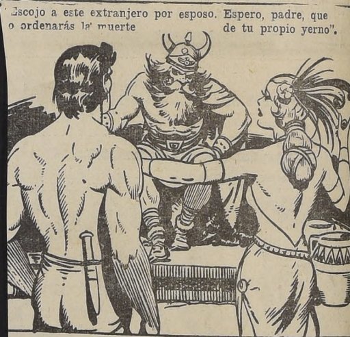
Escojo a este extranjero por esposo. Espero, padre, que ordenarás la muerte de tu propio yerno".