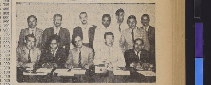
El Comité Provincial de Santiago, de la Unión para la Victoria