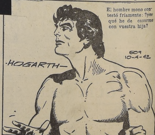
El hombre mono contestó friamente: "¿por qué he de casarme con vuestra hija?"