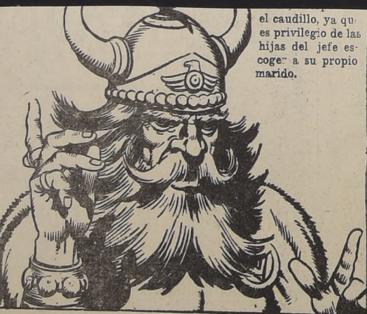
el caudillo, ya que es privilegio de las hijas del jefe escoger a su propio marido.