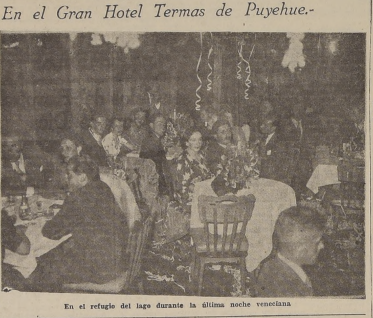
En el refugio del lago durante la última noche venezolana.