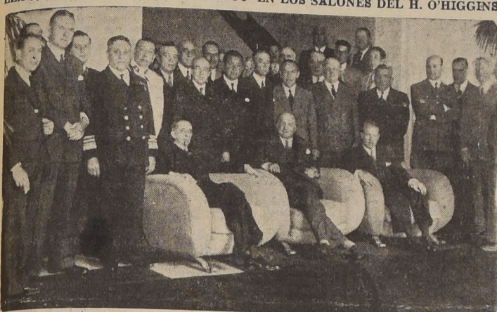
Asistentes al acto de entrega de las condecoraciones al Embajador Bowers y al Adicto de Estados Unidos, señor Garrison

IGUAL DISTINCION LE FUE OTORGADA TAMBIEN AL ADICTO A LA EMBAJADA, SR. BIDDLE GARRISON.—LA CEREMONIA QUE ALCANZO BRILLANTES CARACTERES SE EFECTUO EN LOS SALONES DEL H. O'HIGGINS