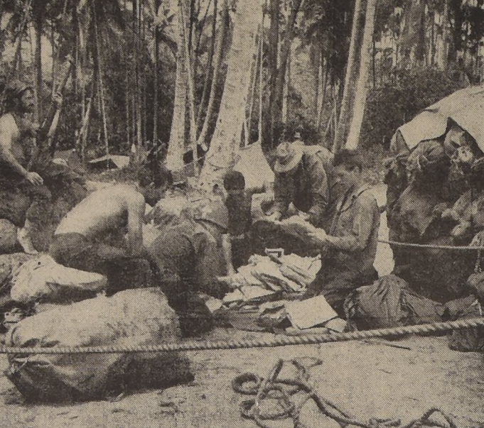
Tropas norteamericanas que combaten en el corazón de las selvas de Nueva Guinea, durante la distribución de la correspondencia que acaba de llegar de la lejana patria...