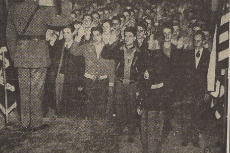
El juramento de la bandera de centenares de jóvenes boyokirinos que acaban de ser llamados a prestar servicio militar...