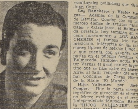
HOY EN SU MARTES DE ESTRENO extraordinario, el Teatro BALMACEDA presenta el estreno de la graciosa revista "Dejémoles Pá Callao"...