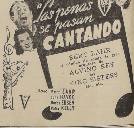
¡ECLOSION DE ESTRELLAS DEL CINE, RADIO Y TEATRO! reunidas en la más deslumbrante y original comedia musical