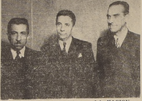
La comisión que visitó ayer LA NACION