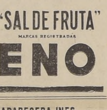
La suave acción laxante de este preparado ha validado la aceptación del público...