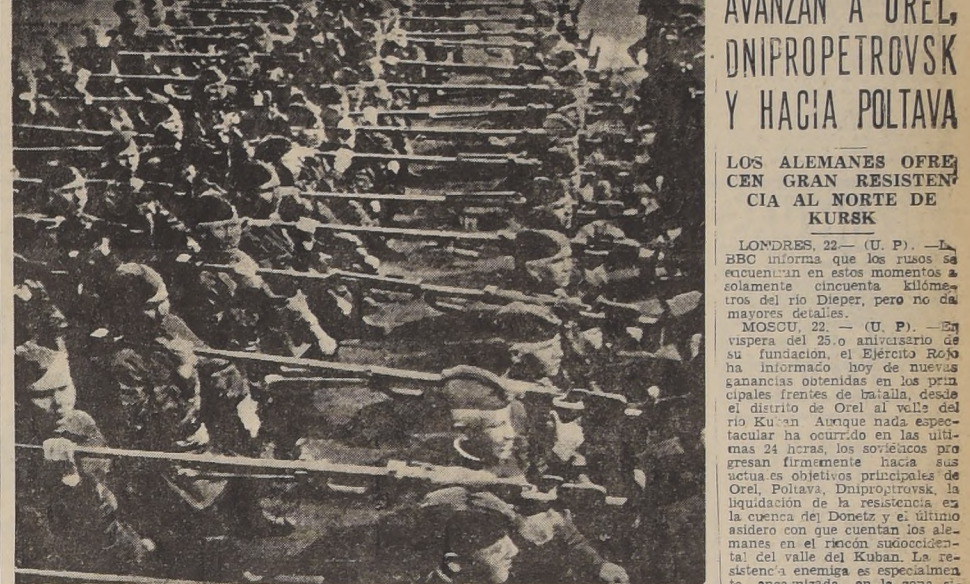
Un batallón de rifleros antitanque del ejército ruso.

ROOSEVELT SERIA POSIBLE CANDIDATO A UN 4.º PERIODO