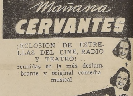
¡ECLOSION DE ESTRELLAS DEL CINE, RADIO Y TEATRO! reunidas en la más deslumbrante y original comedia musical