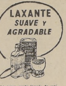
La suave acción laxante de este preparado ha validado la aceptación del público...