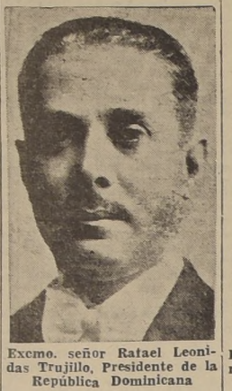
Excmo. señor Rafael Leonidas Trujillo, Presidente de la República Dominicana