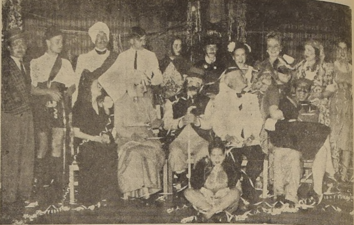
Grupo de disfrazados que tomaron parte en la Fiesta de Disfraces realizada la semana pasada en la Boite del Hotel.