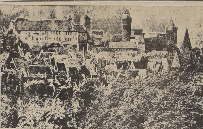
Un aspecto del barrio antiguo en Nuremberg, importante ciudad industrial alemana, que ha sido objeto de una de las más violentas incursiones de la Real Fuerza Aérea

LAS GUARNICIONES ALEMANAS SON ANIQUILADAS EN COMBATES CUERPO A CUERPO