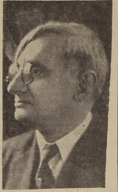
Excmo. señor Julio M. Cesteros, Ministro de la República Dominicana en Chile

La República Dominicana celebra hoy el 99.º aniversario de su independencia nacional, lapso durante el cual ha alcanzado un alto grado de progreso que la coloca entre las adelantadas de Centro América.