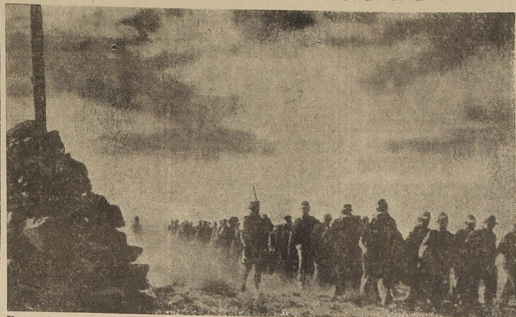
Una columna de oficiales y soldados alemanes caídos en manos británicas en el África. En los campos de prisioneros, aumenta cada día inconscientemente el número de cautivos.