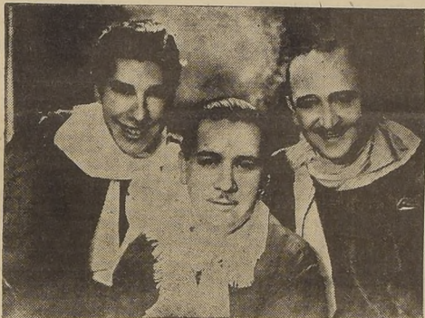
Estos renombrados artistas harán su debut hoy lunes, actuando en la Hora de Té, Aperitivo, Noche.

El famoso trío argentino "LOS PAMPEROS", interpretando típicas canciones con la maestría que los caracteriza, deleitarán a nuestro distinguido público.