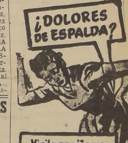
¿DOLORES DE ESPALDA?