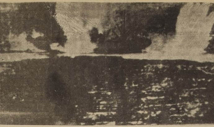
La presente telegrafía muestra el momento en que una certera bomba lanzada por una fuerza voladora hace un impacto directo en uno de los transportes del convoy japonés destruido en el Archipiélago de Bismarck.

Como se recordará, en este decisivo hecho de armas fué totalmente aniquilado no sólo el convoy de 12 transportes enemigos, sino también, los 10 barcos de guerra que les servían de protección.