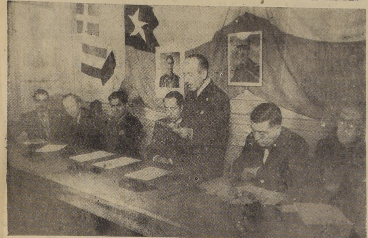
El Canciller en los momentos de pronunciar su discurso

LA ENTREGA OFICIAL DE ESTA AYUDA SE EFECTUO AYER EN UN SIGNIFICATIVO ACTO, CON ASISTENCIA DEL MINISTRO DE RELACIONES EXTERIORES Y DE OTRAS PERSONALIDADES...-LOS DISCURSOS...-DISTRIBUCION DE LOS FONDOS ENTRE LAS NACIONES COMBATIENTES