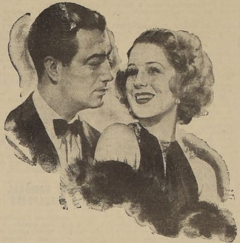
Norma Shearer y Robert Taylor forman la pareja ideal que protagoniza este nuevo film del sello Metro