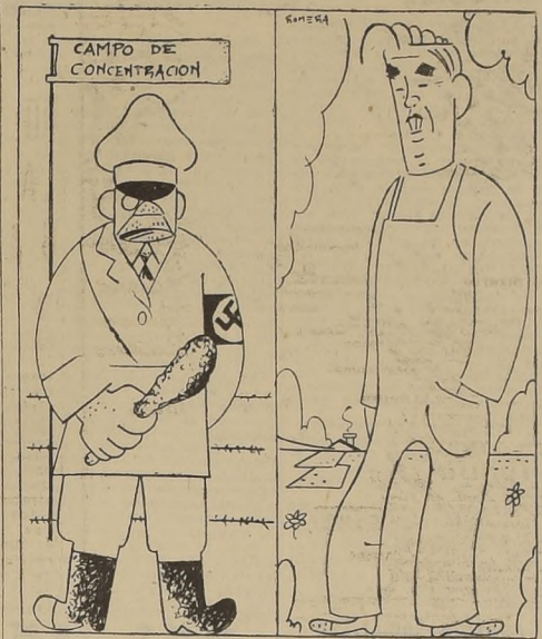
EL NAZI.— Este es Mein Kampf WALLACE.— Este es mi campo.