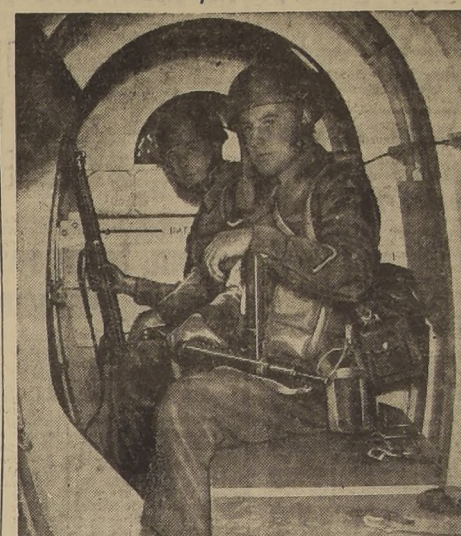
Dos miembros de un regimiento británico de planeadores, con su equipo completo, dentro de este avión de transporte de tropas. Los pilotos instructores de la R. F. A. preparan activamente a los que van a ser pilotos de planeadores.