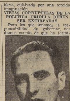
D. Raúl Morales Beltrami, Ministro del Interior

El discurso, que fué radiodifundido por medio de una cadena nacional de emisoras, es del tenor siguiente: "Esta charla con el país tiene, más que nada, el sentido de un análisis de los viejos vicios filosóficos que hizo ya el camino de la calle y de la política que