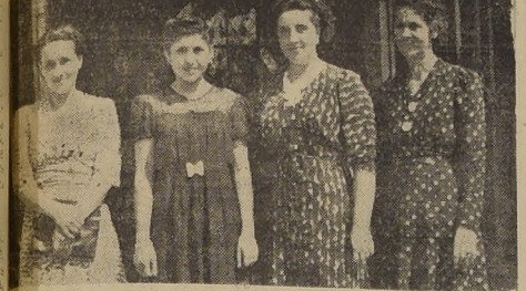
Inquiriera a derecha: señora de Oviedo, la Reina Aydeé I. señora de Silva y señora de Valdés. Estas damas estuvieron cargo de los escrutinios, para la elección de Reina de las Fiestas

LA "REINA DE LAS FIESTAS MAIPUSINAS" FUE CORONADA EN UNA VELADA ARTISTICA QUE ALCANZO BRILLANTE EXITO.—EL LUNES SE EFECTUARA UN GRAN BANQUETE EN EL VECINO PUEBLO