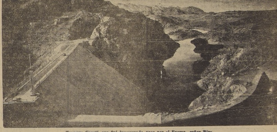
Tranque Copeñi, que fué inaugurado ayer por el Excmo. señor Ríos

DESPUES DE RECIBIR EL SALUDO DE TODAS LAS POBLACIONES DEL TRAYECTO, S. E. FUE ACLAMADO EN AQUELLA CIUDAD POR 5.000 PERSONAS.—PROGRAMA QUE SE DESARROLLARA HOY EN SU HONOR