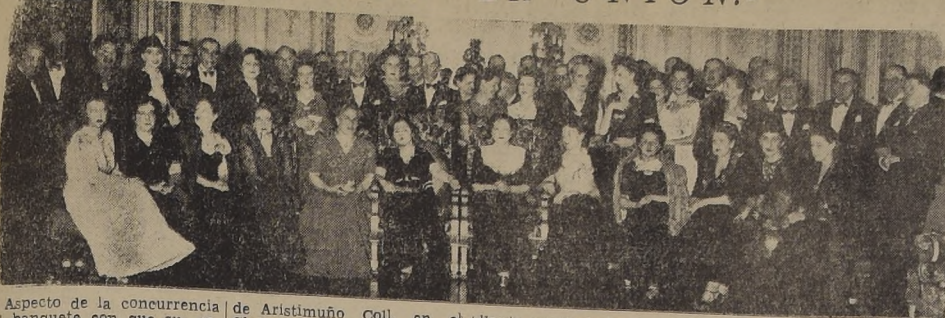
Aspecto de la concurrencia al banquete con que se despidieron al Ministro de Venezuela y señora...