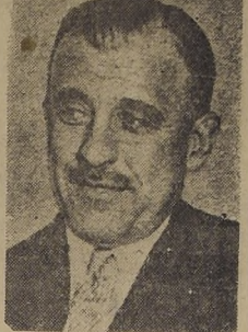
El general Gómez Jordana, Ministro de Relaciones del Gobierno de Franco

DISCURSO DEL GENERAL JORDANA CON OCASION DE CELEBRARSE EL 450.º ANIVERSARIO DEL REGRESO DE COLON A ESPAÑA