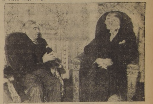
El primer Embajador de Venezuela, conversando con el Excmo. señor Ríos