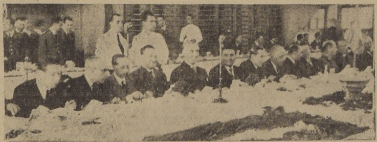
Mesaj de honor, presidida por S. E., en el banquete de ayer.

Especial lucimiento revistieron los numerosos actos efectuados ayer en nuestra capital, con motivo de conmemorarse el "Día del Carabiniero".