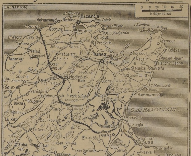
Mapa del frente de Túnez, donde las fuerzas aliadas han continuado su sostenido avance, haciendo que el cerco en torno al Eje se haga más estrecho y aumente la amenaza sobre la capital de la Regencia y Bizerta