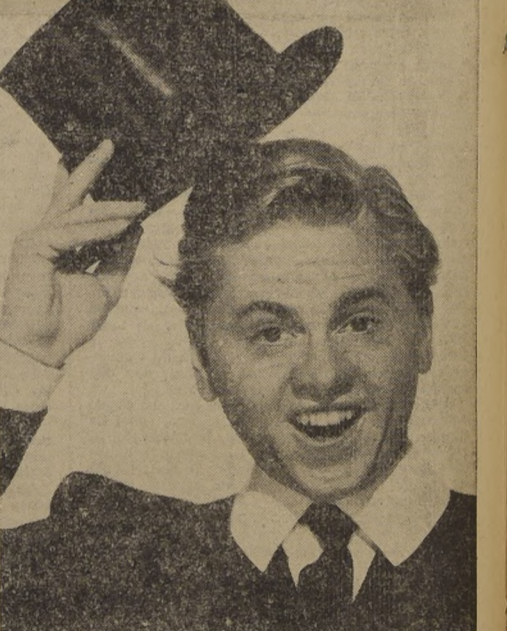
Mickey Rooney, el actor más popular del cine actual, esta vez de sombrero de copa y como estudiante de la Universidad de Eton en Inglaterra, regalará con su más graciosa creación para los Estudios de Metro Goldwyn Mayer.