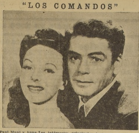
Paul Muni y Anna Lee, intérpretes principales de la gran superproducción "Columba", "LOS COMANDOS", cuya primera de gala en beneficio de la Cruz Roja Noruega se efectuará en fecha próxima en el Teatro Central