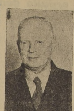
Excmo. señor Arild Huitfeldt, Ministro de Noruega en Chile