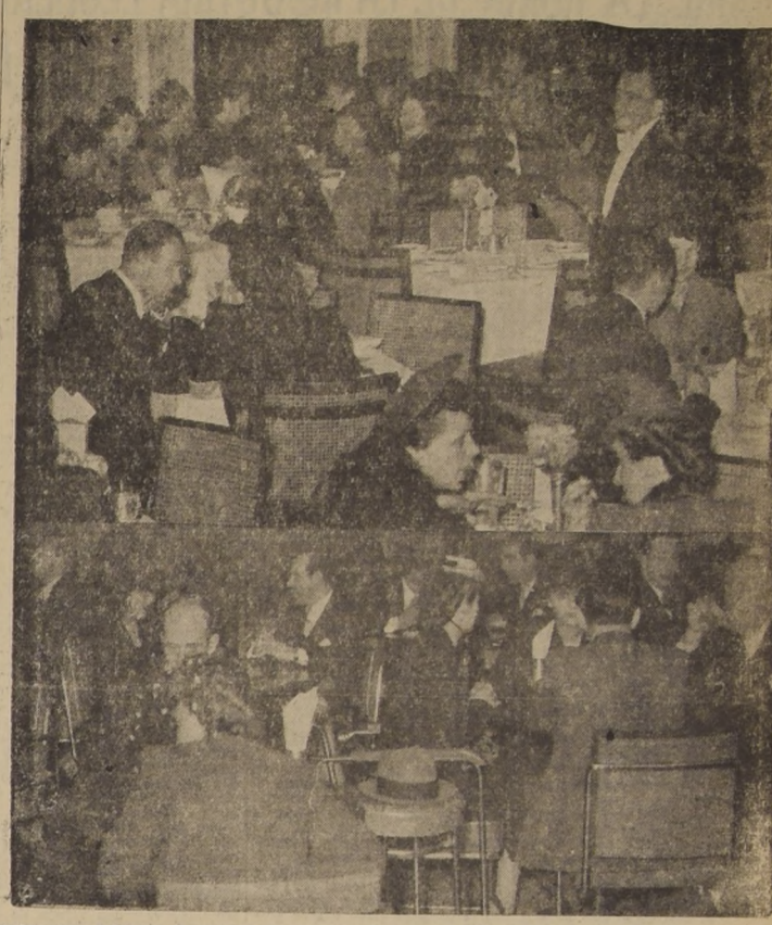
Asistentes al Living durante los conciertos de la hora del té. Esta tarde el maestro Guy de Nogrady, con la sinfónica del Hotel, nos presentará el siguiente programa de música selecta...