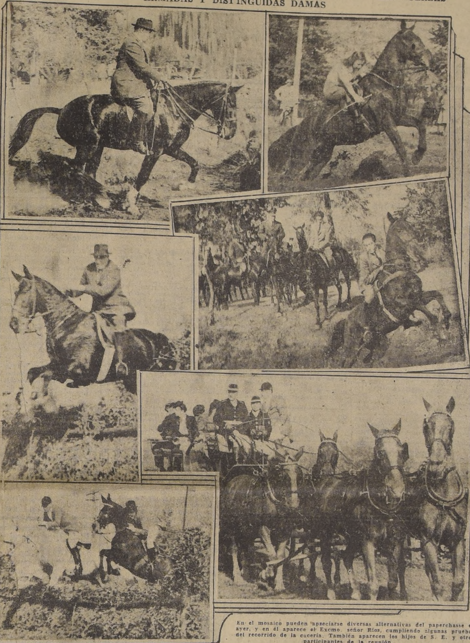
En el mosaico pueden apreciarse diversas alternativas del paperchase de ayer, y en él aparece el Excmo. señor Ríos, cumpliendo algunas pruebas del recorrido de la cacería. También aparecen los hijos de S. E. y otros participantes de la reunión.

PARTICIPARON ALREDEDOR DE 350 JINETES Y CONCURRIERON MIEMBROS DEL CUERPO DIPLOMATICO, ALTOS FUNCIONARIOS DEL GOBIERNO, MIEMBROS DE LAS FUERZAS ARMADAS Y DISTINGUIDAS DAMAS