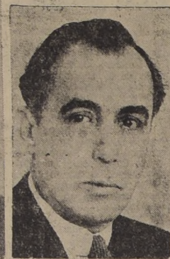
Excmo. señor Enrique Pizzi de Porras, Ministro de Cuba en Chile