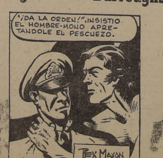
LA EXPERIENCIA DE TARZAN COMO LUCHADOR LE DIO LA VICTORIA SOBRE LOS TRIPULANTES.