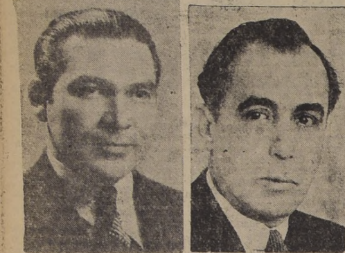
Excmo. señor Fulgencio Batista, Presidente de la República de Cuba