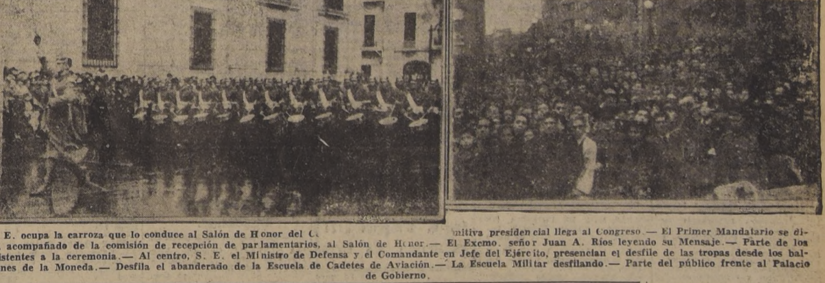
S. E. ocupa la carroza que lo conduce al Salón de Honor del Congreso. — El Primer Mandatario se dirige, acompañado de la comisión de recepción de parlamentarios, al Salón de Honor. — El Excmo. señor Juan A. Ríos leyendo su Mensaje. — Parte de los asistentes a la ceremonia. — Al centro, S. E. el Ministro de Defensa y el Comandante en Jefe del Ejército, presencian el desfile de las tropas desde los balcones de la Moneda. — Desfila el abanderado de la Escuela de Cadetes de Aviación. — La Escuela Militar desfilando. — Parte del público frente al Palacio de Gobierno.

4 Ingenieros recorrieron las 21 Repúblicas Americanas