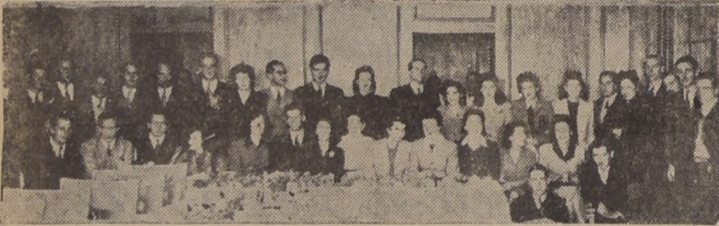
Un grupo de amistades que despidieron de su vida de solteros, en un almuerzo en el Club de Golf de Los Leones...

Ud. PUEDE BLANQUEAR SU CUTIS, volviéndolo más claro con CERA MERCOLIZADA