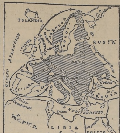
Las flechas indican la dirección que, posiblemente, tomaría la ofensiva general aliada para la invasión de Europa. Toda la parte sombreada corresponde a la que se encuentra bajo la dominación del Eje.

Según informaciones italianas la destrucción en Sicilia y Cerdeña es tan silenciosa desde un comienzo y que "los pueblos grandes han sido casi completamente destruidos y que sólo han quedado los comandos".