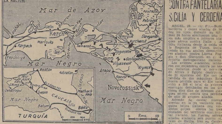
En el mapa, en grande escala, de la Península de Taman, han sido señalados los puntos donde los rusos ejercen una mayor presión sobre el enemigo. En el recuadro de la izquierda se fija la ubicación de la península y la zona de Novorossik.