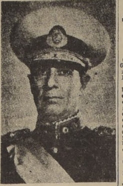
General Pedro Ramirez, Presidente Provisional de la Nación Argentina