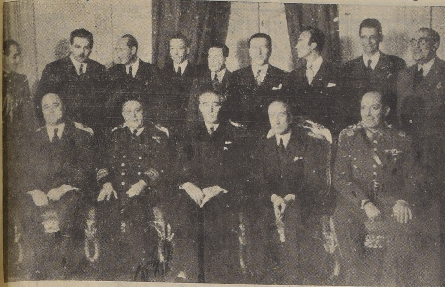
S. E. el Presidente de la República, acompañado de sus nuevos Ministros de Estado

LOS NUEVOS MINISTROS PRESTARON JURAMENTO ANOCHE, A LAS 20.20 HORAS