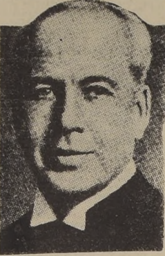
Almirante Storni, designado Canciller en el nuevo Gabinete argentino