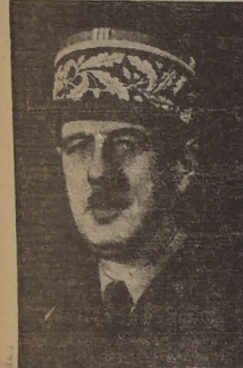
General De Gaulle