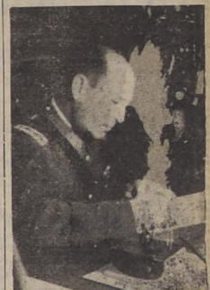
Ministro de Defensa, general señor Oscar Escudero

Ministro del Interior vicealmirante señor Julio Allard