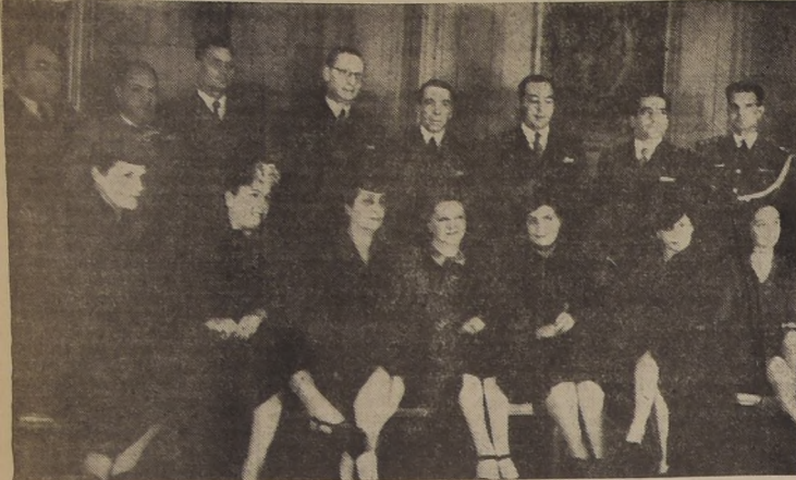
En la Embajada del Brasil se efectuó en la tarde de ayer la ceremonia de entrega de condecoraciones otorgadas por el Gobierno de ese país...