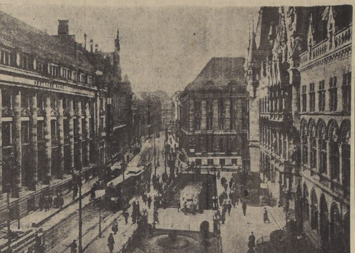
Vista del centro comercial de Colonia, que ayer sufrió un nuevo bombardeo de la RFA.