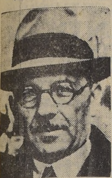
Sarajoglu, Primer Ministro turco, quien pronunció ayer un significativo discurso sobre las relaciones de su país con Rusia.

ANGORA, 17. — (U. P.). — El Primer Ministro Chukru Sarajoglu, en un discurso sensacional pronunciado ante el Partido del Pueblo de Turquía, hizo un ofrecimiento de amistad sin precedentes y reafirmó categóricamente las alianzas de amistad turco-rusas y Anglo-turcas. El discurso ha sido una de las más francas declaraciones en favor de las Naciones Unidas manifestadas hasta ahora por un país neutral, y los círculos aliados de ésta afirman que refleja la creencia creciente entre los países neutrales de que la victoria de las Naciones Unidas es segura.