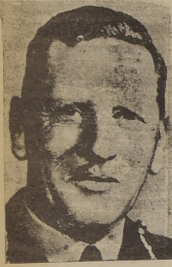
El General Auchinleck, designado para reemplazar al Mariscal Wavell como comandante de las fuerzas de la India.