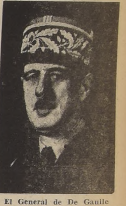
El General de Gaulle

De Gaulle otorgó estas condecoraciones cuando era aún jefe de la Francia Combatiente, con sede en Londres.