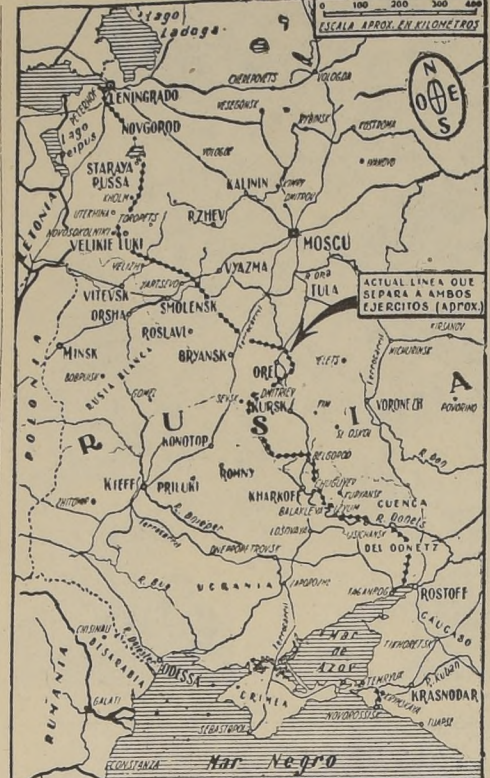
El frente ruso desde Leningrado al Mar Negro.

TEXTO DEL COMUNICADO. El comunicado decía: "Aeroplanos soviéticos de bombardeo de gran autonomía de vuelo realizaron el viernes en la noche incursiones contra aeródromos enemigos..."