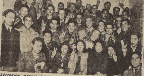
Jóvenes comunistas que ayer visitaron este diario

IMPORTANTES ACUERDOS ADOPTADOS EN EL CONGRESO REGIONAL QUE TERMINARA HOY