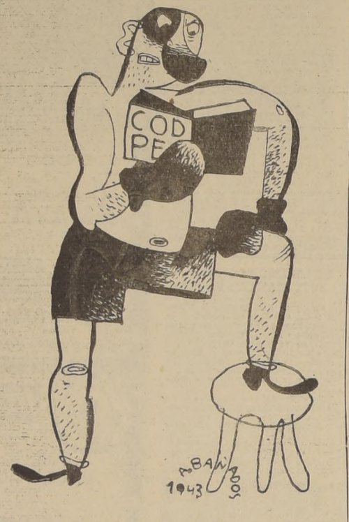
Un boxeador leyó consulta el Código Penal antes de iniciar la pelea...