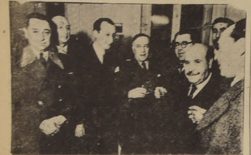
Algunas de las personalidades asistentes a la manifestación de ayer