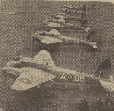
"El Mosquito", bombardero de reconocimiento de la R. F. A. efectúa ataques de largo alcance, sin necesidad de escolta de combate. Ha llevado los combates diarios a Alemania.