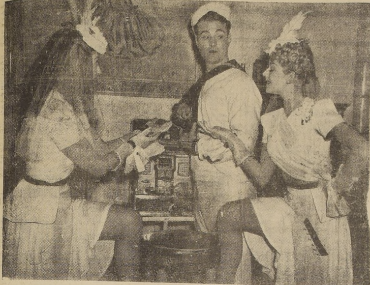
Red Skelton y Ann Sothern son los principales protagonistas de esta deliciosa comedia musical. La actuación de Carmen Amaya y Lena Horne presta una mayor atracción a esta gran película.

En las funciones de mañana, miércoles, jueves y noche, presentará el Teatro Metro una nueva producción musical de la Metro Goldwyn Mayer, nos referimos a "La Rubia Audaz", modernización de la famosa revista "Panama Hat", que recorrió los escenarios del mundo entre los más elogiosos aplausos.