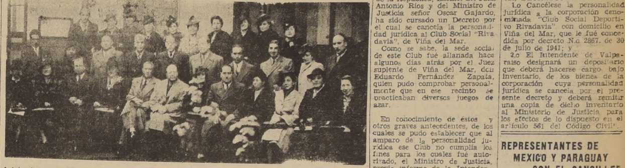
Asistentes a la reunión inaugural de la Convención de Profesores de Escuelas Normales