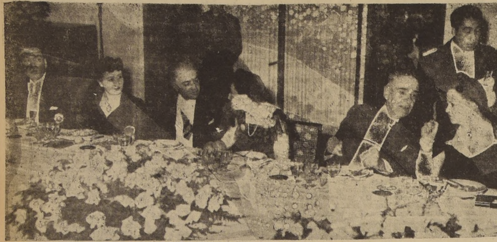
Un aspecto del Gran Comedor durante el banquete ofrecido por el señor Ministro de Relaciones Exteriores don Joaquín Fernández en honor del Excmo. señor Embajador de Colombia, don Agustín Nieto Caballero y señora, durante el cual recibió la condecoración al Mérito en el grado de Gran Cruz, que le otorgara nuestro Gobierno.