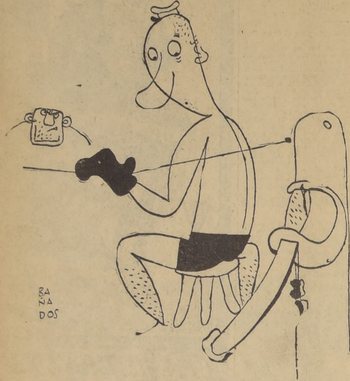
SA NA DOS

EL PROGRAMA CORRESPONDE A LA RUEDA SEMIFINAL DEL CAMPEONATO ORGANIZADO POR LA UNIVERSIDAD DE CHILE. — EL EXAMEN MEDICO Y PESAJE