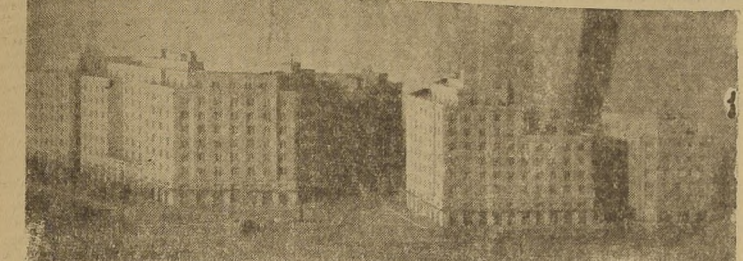
Maquette de las construcciones que se levantarán en la Avenida Paraguay, que se inaugura hoy, ubicada en Avda. O'Higgins esquina de Carmen.

EXCMO. SR. MORINIGO INAUGURARA HOY LA FUTURA AVENIDA PARAGUAY LAS FUERZAS ARMADAS LE OFRECERAN HOY UN ALMUERZO EN LA ESCUELA DE AVIACION DE "EL BOSQUE" EL ILUSTRE HUESPED SE DESPEDIA DEL PRESIDENTE RIOS ESTA TARDE, PUES MAÑANA, A PRIMERA HORA, ABANDONARA EL PAIS