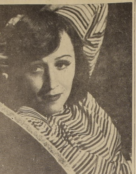
La gran intérprete de la poesía, Berta Singerman, que hoy ofrece la primera audición poética en nuestro Teatro Municipal.

Hoy, a las 18.30 horas, se efectuará el primer recital de la eminente intérprete de la poesía, Berta Singerman. Es ella demostando conocida entre nosotros, para que nos detengamos a hacer el elogio de su personalidad artística, basta con decir que es la creadora de un arte y que lo ha impuesto triunfalmente en todos los escenarios de América.