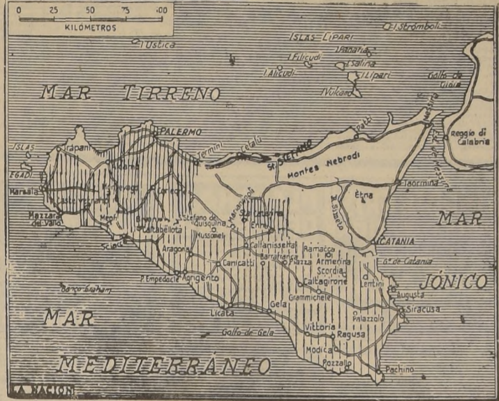
Las líneas verticales señalan aproximadamente la zona ocupada hasta la tarde de ayer (informaciones de última hora indican que con la conquista de Trapani y Termini ha quedado prácticamente completa la ocupación de Sicilia occidental. La flecha indica el avance americano en persecución de las fuerzas del Eje que se repliegan hacia el Este).