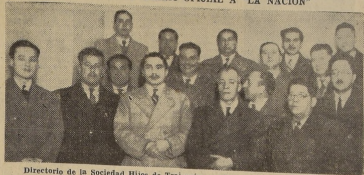
Directorio de la Sociedad Hijos de Traiguén y algunos de sus socios

EMITIRA PARA TAL OBJETO DIEZ MIL BONOS DE $ 50 CADA UNO. — DESIGNO SU DIARIO OFICIAL A "LA NACION"