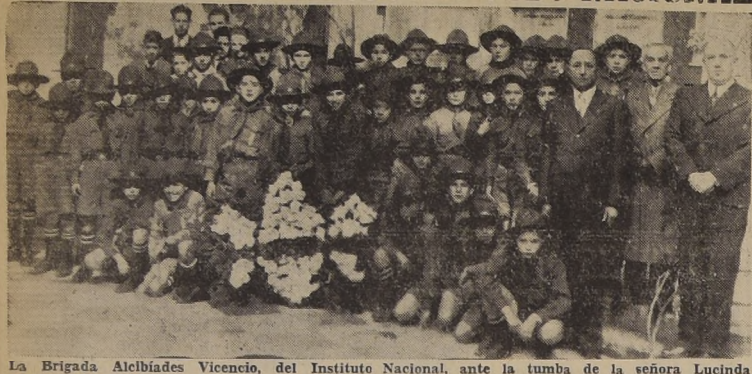
La Brigada Alcibíades Vicencio, del Instituto Nacional, ante la tumba de la señora Lucinda Morales de Rios.

Una sentida ceremonia realizáronse ayer en el Cementerio General los boy scouts de la Brigada "Alcibíades Vicencio" N.º 1 del Instituto Nacional, visitando la tumba de la señora Lucinda Morales de Rios, en el primer aniversario de su fallecimiento.