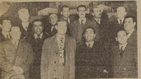
Los dirigentes gremiales norteamericanos en su alojamiento del Hotel Carrera.

REPRESENTAN A LA FEDERACION AMERICANA DEL TRABAJO, CONGRESO DE ORGANIZACIONES INDUSTRIALES Y HERMANDAD DE OBREROS FERROVIARIOS.— LOS ACTOS OFICIALES