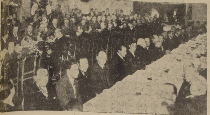
Un aspecto del banquete

ASISTIERON MINISTROS DE ESTADO, INTELLECTUALES, PERIODISTAS, ARTISTAS, EX ALUMNOS Y NUMEROSOS AMIGOS DEL FESTEJADO