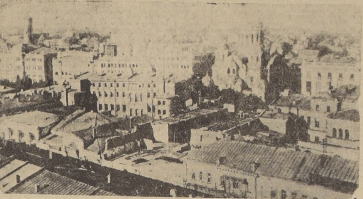
Panorama de Kharkov, antes de que la ciudad fuera destruida por los numerosos asedios y batallas que ha sufrido durante la campaña de Rusia.