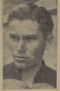
Ataglich, centro half del Badminton