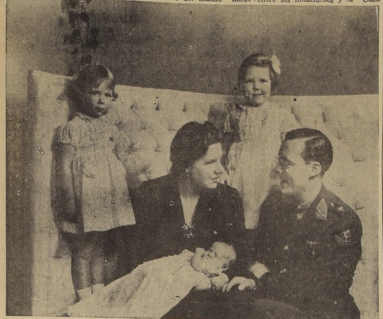
La Princesa Juliana, heredera del trono de Holanda, con su esposo el Príncipe Bernhard y sus tres hijas, las Princesas Beatrix, Irene y Margarita Francisca.