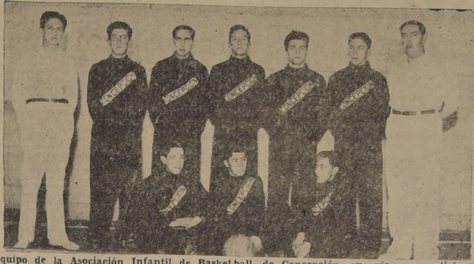
Equipo de la Asociación Infantil de Basketball, de Concepción, que viene a participar en el Campeonato Nacional que se inicia el miércoles en esta capital