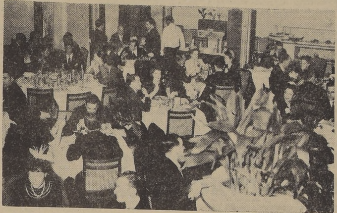
El Roof Garden durante una de sus reuniones sociales de la semana, concurrido, como de costumbre, por distinguidas familias