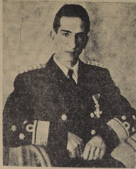
S. M. Pedro II de Yugoslavia, cuyo 20.º aniversario de su natalicio se celebra hoy