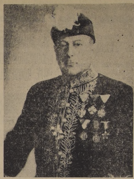
Doctor Djuro Kolombatovic, Ministro de Yugoslavia en Chile